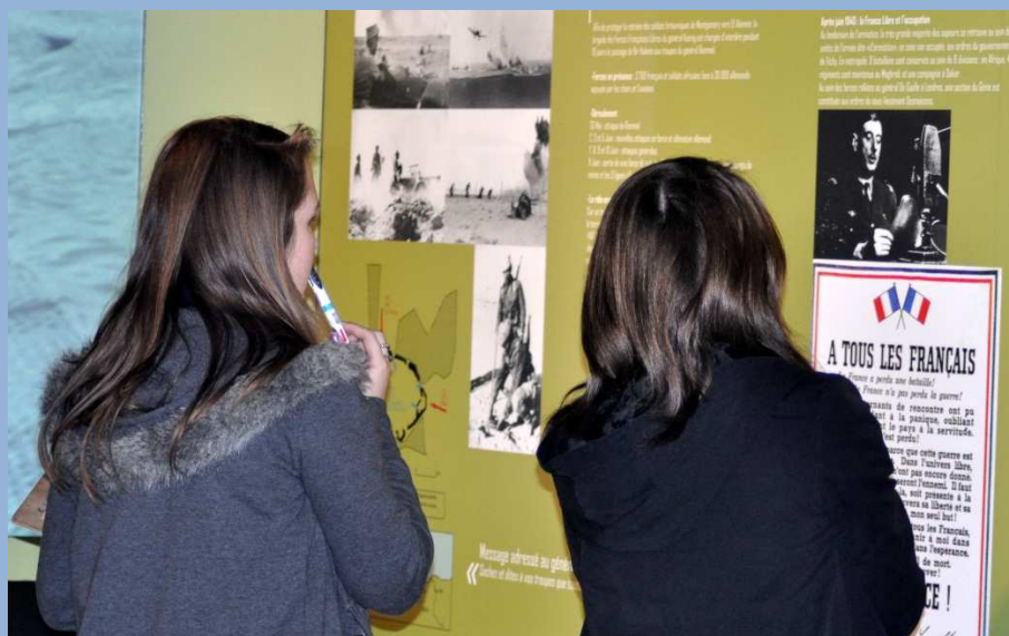
Découverte du musée du Génie et activités en autonomie

Profitez des ressources et de la proximité de deux sites culturels pour approfondir programmes scolaires (histoire, éducation civique, histoire des arts, etc.) et compétences du socle commun