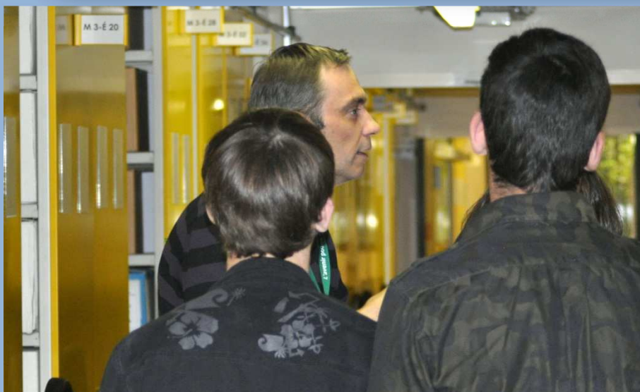
Visite des Archives départementales et travail sur documents originaux

Profitez des ressources et de la proximité de deux sites culturels pour approfondir programmes scolaires (histoire, éducation civique, histoire des arts, etc.) et compétences du socle commun