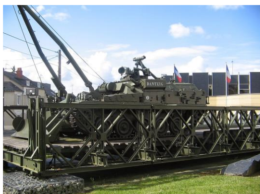
Le pont Bailey du Musée du Génie

La maquette d'instruction des équipages de pont est elle-même un objet historique.