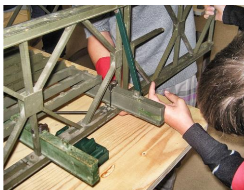
L'atelier « pont de la Victoire »