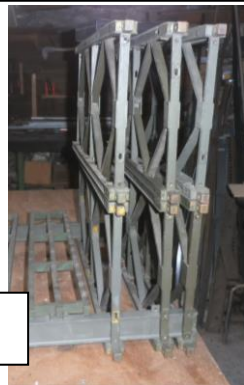
6 panneaux juxtaposés et superposés (Triple double)

L' idée géniale est d'avoir mis au point un système modulaire qui permet de constituer des poutres latérales en treillis par la juxtaposition et la superposition de panneaux strictement identiques (jusqu'à 9 panneaux). Il est dès lors possible de réaliser des ponts pour le passage d'éléments légers comme des plus lourds tels que les chars et les trains.