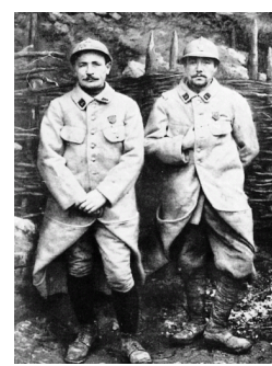
Poilus-Sapeurs, 1 ère Guerre mondiale