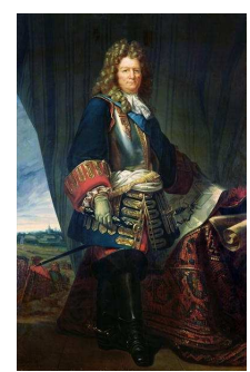
Vauban, le « père du Génie »