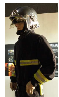
Sapeur-pompier de Paris