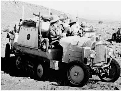
Autochenille Citroën 15 CV Type B2 1924

Le concept de transport de troupe semi-chenillé, légèrement blindé, apte à évoluer en tout terrain, est né au début du XX e siècle. L'ingénieur français Adolphe Kégresse, expatrié en Russie, expérimente les premiers modèles en 1904.